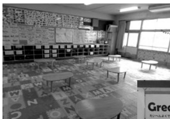
アルファベットマット 角の丸いテーブル

次に、教室掲示についてである。後方に「声かけ例」の掲示物があり、子どもたちの活動を視覚的に支援することができる。教師も、それを見ながら、子どもたちへ指導できる良さがある。