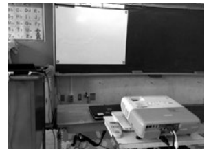
▲プロジェクタとスクリーンシート

本市ではタブレット型パソコンが導入されており、外国語活動の重要な教具の一つとなっている。